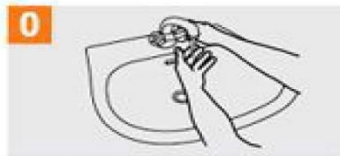
0 Busti eskuak urarekin.