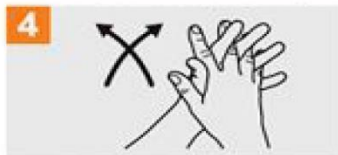
4 Igurtzi esku-ahurrak elkarrekin, atzamarrek korapilatuta dituzula.