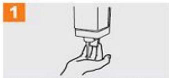
1 Jarri esku-ahurrean eskuen azalera osoa estaltzeko adina xaboi.