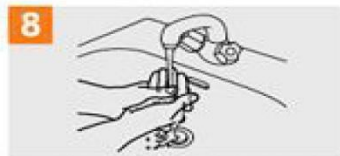
8 Eskuak uretatik pasatu.