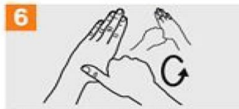
6 Igurtzi ezkerreko atzamar lodia eskuineko esku-ahurraren barruan, errotazio-mugimendua eginez, eta alderantziz.