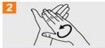
2 Igurtzi esku-ahurrak elkarrekin.