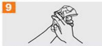
9 Lehortu behin erabiltzeko toalla batekin.