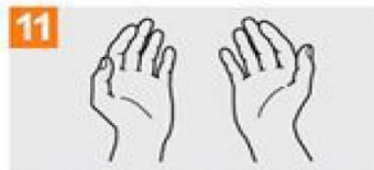
11 Zure eskuak seguruak dira.