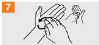
7 Igurtzi eskuineko eskuko atzamarren punta ezkerreko esku-ahurraren kontra, errotazio-mugimendua eginez, eta alderantziz.