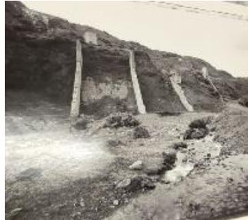
Cobo, Patxi Ortuella, Bizkaia, 19/11/1953 [sin título] 1992 44,5 x 50,4 cm Fotografía