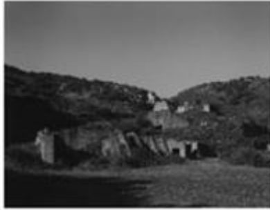
Cobo, Patxi Ortuella, Bizkaia, 19/11/1953 [sin título] 1992 50 x 60 cm Fotografía