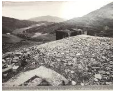
Cobo, Patxi Ortuella, Bizkaia, 19/11/1953 [sin título] 1992 44,5 x 50,4 cm Fotografía