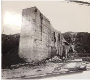
Cobo, Patxi Ortuella, Bizkaia, 19/11/1953 [sin título] 1992 44,5 x 50,4 cm Fotografía