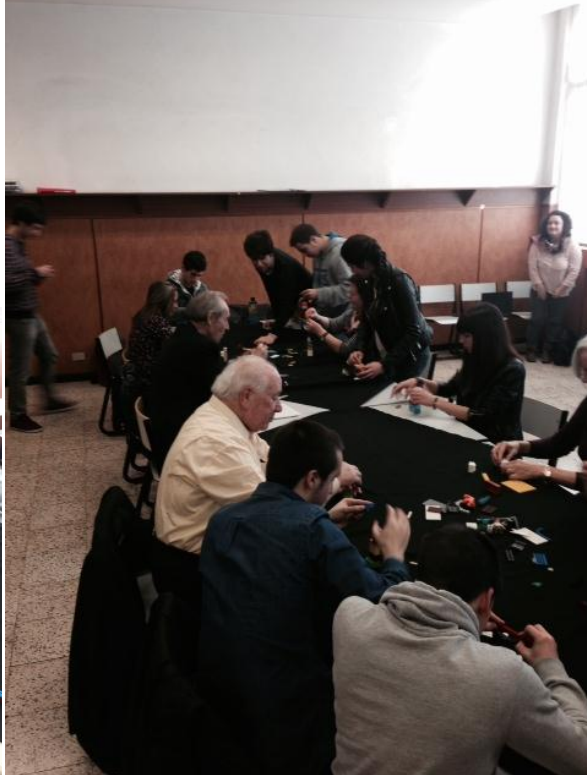
“Talleres de innovación: construyendo participación” organizados por Europe Direct Bizkaia. Colaboración para recoger aportaciones en el proceso de construcción de un Libro Blanco de Democracia y Participación Ciudadana para Euskadi